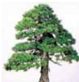
町の木 ゴヨウマツ