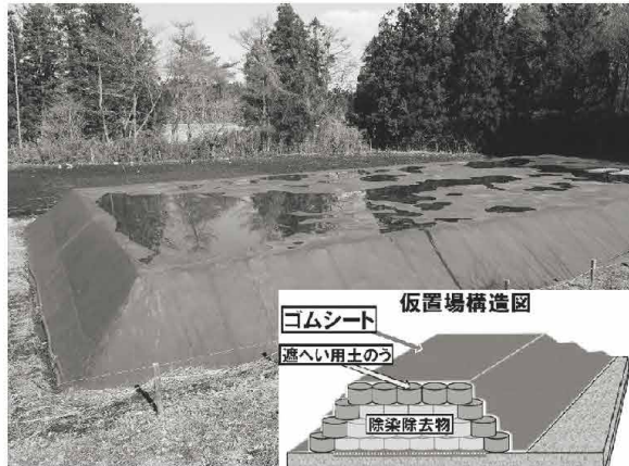
指定廃棄物の仮置場と構造