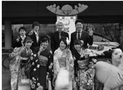
平成29年那須町成人式実行委員の皆さん