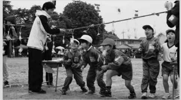
黒田原小運動会 1年障害物競走 もうすぐゴール

5月27日、黒田原小運動会が行われ小雨が降る中、泥だらけになりながら真剣に戦いました。また、28日に延期になった那須中体育祭では、天候に恵まれ、暑い中一人ひとりが全力を出してがんばりました。