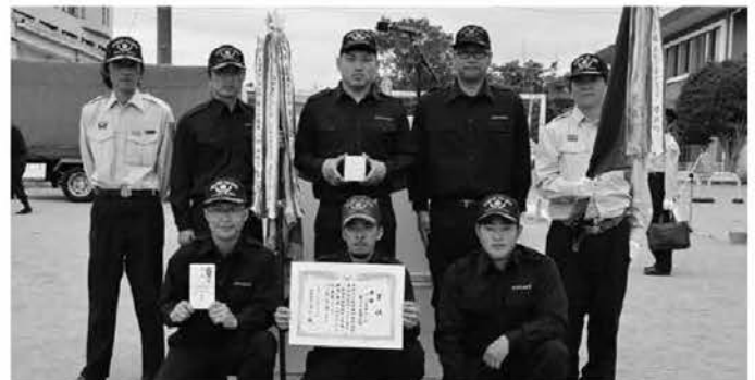
第3分団第3部（養沢）のみなさん