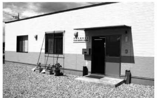
那須町農業公社（黒田原駅北側）