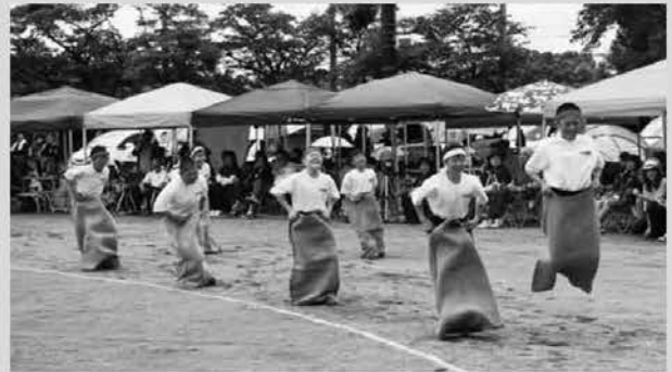
那須中体育祭 1年障害物競走～狙ったお菓子は逃さない～

餅(かすり)姿の早乙女たちが田植え歌に合わせて田植えをしました(6/4 芦野田植え祭)