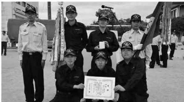
第3分団第4部（稲沢）のみなさん