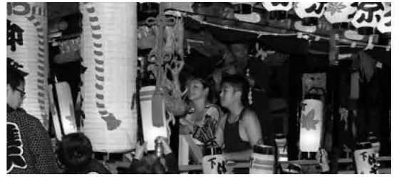
伊王野温泉神社付け祭り(夜)

少子高齢化や人口減少などで、今後の継承活動が危惧されている地域の民俗芸能ですが、今年度の「地域の伝統文化保存維持費用助成」に「伊王野下町保存会」が決定されました。