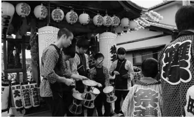
伊王野温泉神社付け祭り(昼)

毎年11月2日・3日に開催されている伊王野温泉神社例祭付け祭りの歴史は古く、これを後世に継承するため、同保存会は囃子保存会を結成し、年間を通して週1回の練習を行っています。小学生か