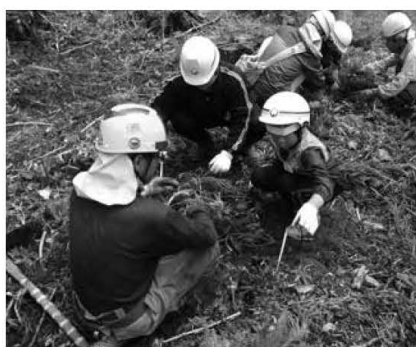
スギの植林体験教室の様子 (伊王野公民館)