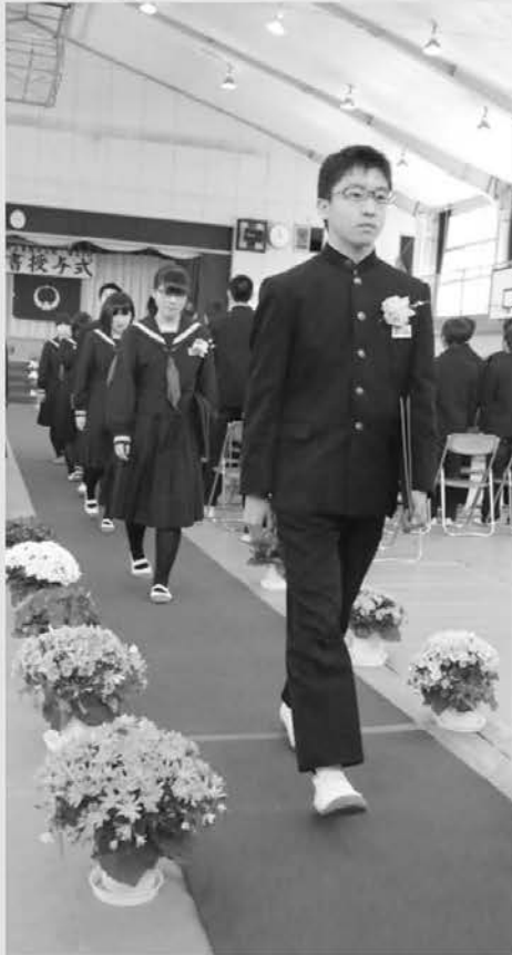
卒業証書を手に夢へ向かって第一歩(東陽中)