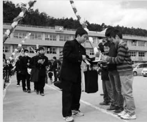
感謝の気持ちを手紙に込めて(東陽小)