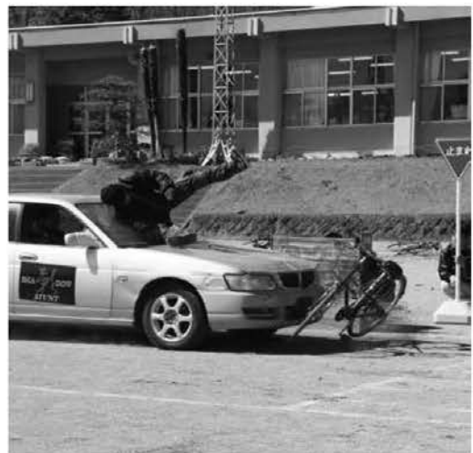
スタントマンが交通事故を再現(交通安全教室)