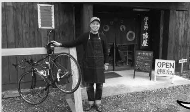
伊王野の交流拠点としてオープンした「伊王野陣屋」

2017年は那須町でたくさん自転車のレース、イベントが開催されます。3月31日から4月2日の3日間で栃木県内を走るラインレース「ツール・ド・とちぎ」では、2日目のゴール地点として「道の駅 那須高原友愛の森」が会場になりました。6月11日には町役場周辺で「那須ロードレース」が開催されますし、7月には毎年恒例の「那須高原ロングライド」が開催されます。私も開催地側の