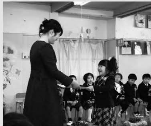
お母さんへ「いつも送り迎えありがとう」(大同保育園)

町内小学校の平成28年度卒業式が、中学校は3月9日、小学校は3月17日に行われました。中学生208人、小学生171人が学び舎を巣立ちました。卒業証書を手にする卒業生たちはたくましい姿でした。 また、保育園は3月22日に修了式が行われ、112人の園児が修了証書を受け取り、たくさんの思い出を胸に園舎に別れを告げました。