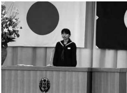
生徒代表あいさつ