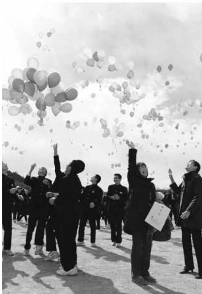
風船に思い出を込めて