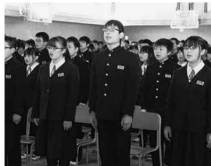
感謝の気持ちを込めて校歌斉唱