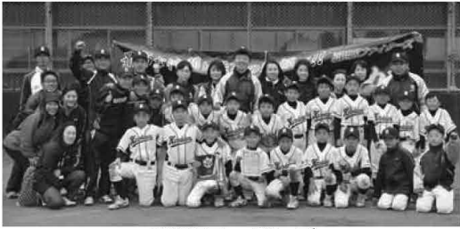
黒田原ファイターズ