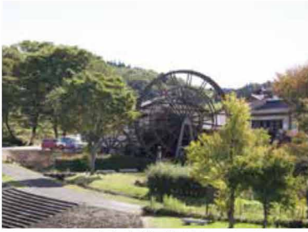
巨大水車が目印です

近くの農家で採れた新鮮野菜が売りの物産センターや、そばソフトが味わえる茶屋は、休日には行列ができるほど人気です。まつり伝承館には、上町と下