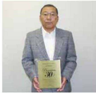
関東の149駅の中から選ばれました

町の屋台が常設展示されています。町無形民俗文化財に指定され、毎年11月2日、3日に行われる伊王野温泉神社付け祭では、両町の屋台が町内を練り歩きます。祭りばやしの競い合いは、見ている者を圧倒します。