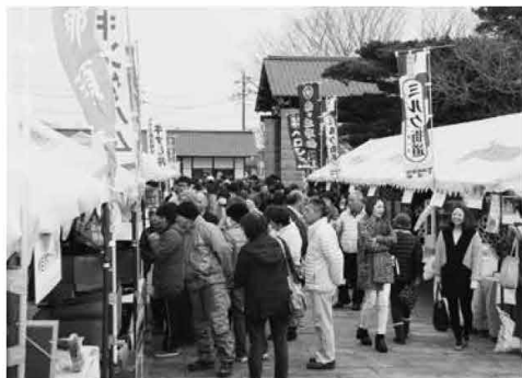
那須の美味しい食が集まり、たくさんの人で賑わいました (3/15 道の駅那須高原友愛の森春の大感謝祭&那須高原ミルク街まつり)