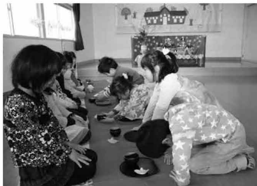
みんなおしゃべりして「お茶をどうぞ」「いただきます」 (3/3 ひなまつりお茶会 高久保育園)