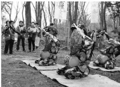
五穀豊稔を祈願し馬頭観音様に奉納されました (3/15 一ツ樫の獅子舞)