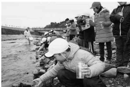
伊王野小3、4年生39名が育てたサケの稚魚も合わせ約800匹を道の駅東山道伊王野近くの三蔵川に放流しました(3/3)