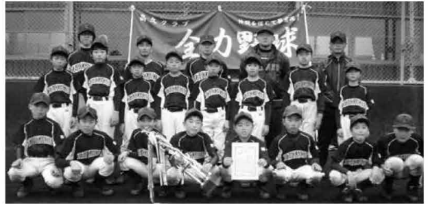
優勝に輝いた高久クラブ