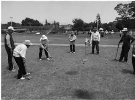
グラウンドゴルフを楽しむ皆さん