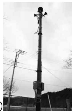
屋外扩声子局(芦野局)