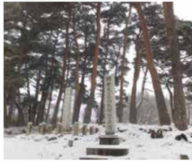
山頂部に建つ記念碑

高久愛宕山の山頂部には赤松林があり、すぐ隣にある高久神社の杉(樹高36m、推定樹齢400年以上)とともに、那須の名木に選ばれています。山の斜面には桜やツツジなどが植栽されていて、町内の桜の名所の一