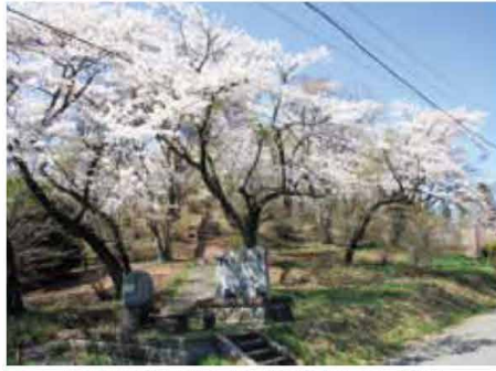
満開の桜が楽しめる高久愛宕山公園

那珂川に架かる晩翠橋から県道黒磯高久線を白河方面へ800mほど向かった左手に小高い山が見えてきます。ここが高久愛宕山公園で、園内には遊歩道やゲートボール場、テニスコートなどが設置され、いこいの場として多くの人に親しまれています。