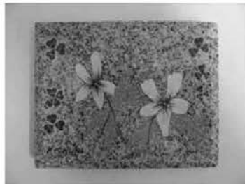
御影石アート見本

また、事前に御影石アートの作品展示を図書館入り口にて行いますのでこちらもぜひご覧ください。