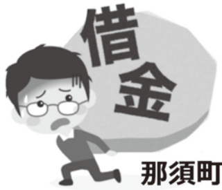
公共施設維持管理の財源不足