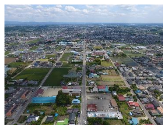
碁盤の目のように区画されたまち