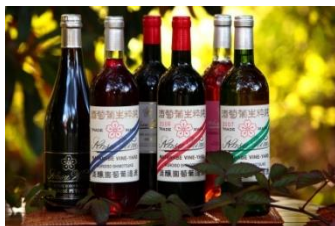
明治17年から醸造されているワイン

しかし、この「極めて平坦な大地」は西洋列強に対抗し殖産興業政策を掲げた政府に開拓地として注目され、その実現に向けて、華族階級が出資する農場が、明治13年から20年代にかけ、次々と開設されました。