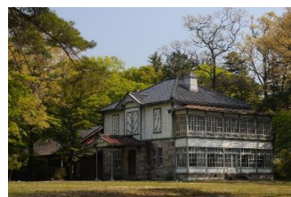
千本松農場跡に建つ別荘

訪れる人々を、柔らかな高原の風と、かつて明治貴族が繰り広げた濃密な浪漫 ものごたがり をもって迎え入れる場所、それが那須野が原です。