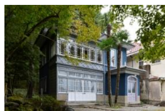
山縣農場内に建つ別荘

栃木県北部に位置する日本最大規模の扇状地「那須野が原」には、明治から昭和にかけて大規模農場がひしめき合った時代がありました。別荘群は、当時の面影をいまに伝える貴重な生き証人です。これらの「大規模農場と別荘」を作り上げたのは、明治維新を牽引した元勳や明治政府の要職を歴任した貴族たち…いわゆる「華族」でした。そして、これら華族農場の成立の背景には、明治政府が推し進めた政策が大きく関わっていました。