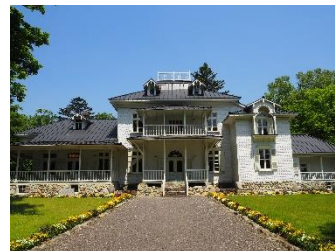
青木農場跡に建つ別荘

長い杉並木を抜けると視界は一気に開け、青空の下にその建物は全貌を現します。中央に物見台を戴くホール棟、左右に羽を広げたように延びる棟にテラスを配した白亜の洋館は、近づくると、壁一面が鷲型の白いスレートで飾られ、屋根に張り出した採光窓が、ユニークな凹凸を描き出しています。まるで映画の一場面のように、いまにも日傘を手に貴婦人が姿を現しそうなその建物は、明治政府で外務大臣を務めた青木周蔵子爵が あおきしゅうざう 残した別荘です。このほかにも、様々な趣向を凝らし広大な敷地を有する別荘が周囲の喧騒とは無縁に点在する場所が、関東地方の北端に存在します。