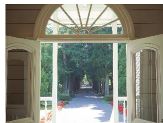
青木駅から望む杉並木