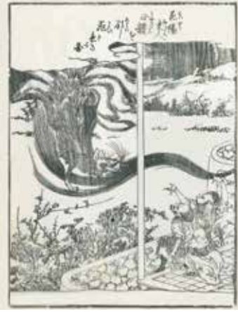
「繪本三国妖婦傳」より

彼が天神であつたことを悟り、その場に九拝する。耆婆は、往路九日を費やして帰宅すると、朝廷の重臣孫晏に事の次第を告げ、薬王樹を見せながら、華陽夫人と問答する機会を設けるよう依頼する。孫晏は他の高官らとともに命