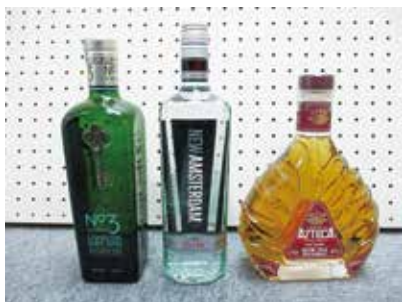
動産公売物品の一例