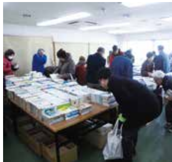
▶ 昨年のリサイクルまつりのようす