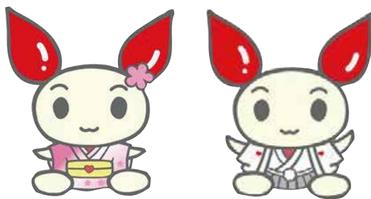
献血推進キャラクター「けんけつちゃん」

冬場から春先にかけては、年間で最も輸血用血液が不足しがちです。また、少子高齢化によって、今健康で若い皆さんの一層の献血への協力が求められています。 新成人の皆さん、「はたちの記念」に献血に行きましょう。皆さんのご協力をお待ちしています。 ▼期 間 1月1日(火)～2月28日(木) ▼場 所 栃木県赤十字血液センター、うつのみや大通り献血ルーム、各市町の献血会場