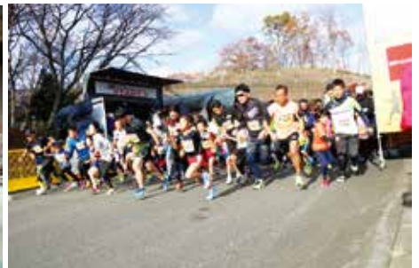
優勝めざして一斉にスタート!