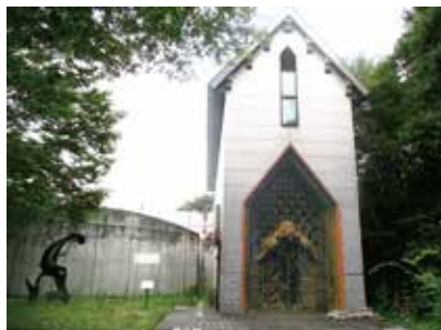
不動産物件は平成29年12月まで美術館として営業していました