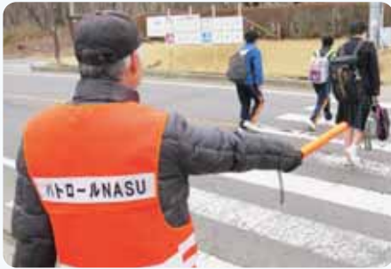
▲登下校の見守り(那須中学校)