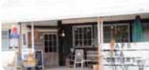
北欧の古民家風カフェはレトロなかき氷旗が目印