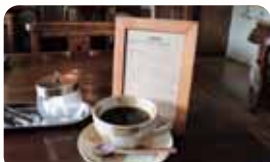
豊かな香りと深いコクが味わえる自家焙煎挽き立て珈琲