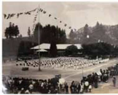
昭和初期の運動会