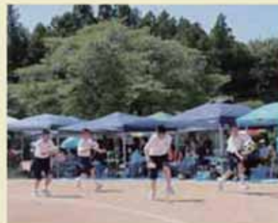
1年生障害走「猪突猛進！ボールを運べ」