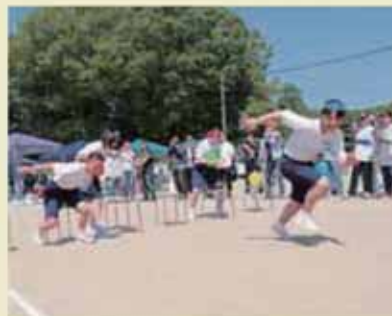
2年生障害走「ドキドキラッキーパラダイス」