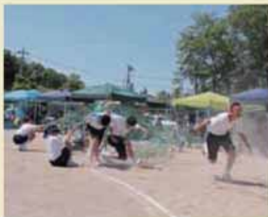
3年生障害走「ときめきパラダイス」

5つの小学校で春季大運動会、2つの中学校で体育祭が行われ、各校で熱戦が繰り広げられました