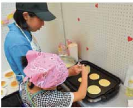
アルバイトの様子