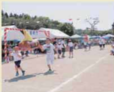
5・6年生親子競技「学びの森ダービー令和記念」