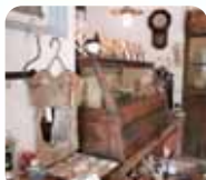
クラフト作家さんたちの作品がお出迎え