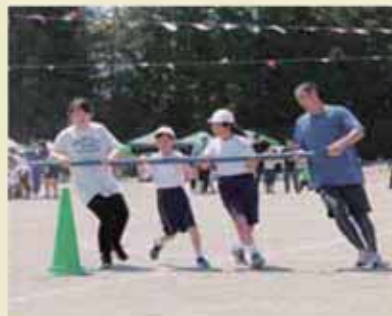
3・4年生親子競技「親子タイフーン」