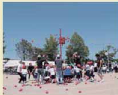
1・2年生親子競技「ダンシング玉入れ」