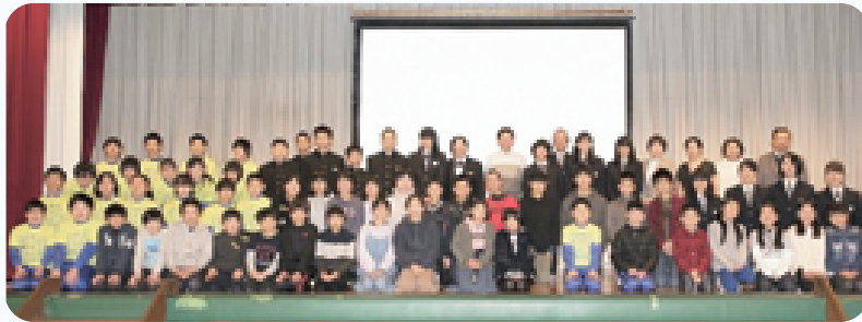
小学生9組、中学生6組が参加しました