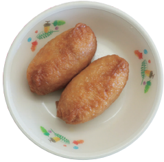
〈おやつ〉 九尾のきつねにちなんだ 稲荷ずし

【概要】 1泊10,000円以上のご宿泊で1人1泊につき5,000円割引！ 1泊6,000円以上10,000円未満のご宿泊で1人1泊につき3,000円割引！ 【割引対象】 栃木県内にお住まいの方のみご利用いただけます。 予約受付開始日以前のご予約については、対象外となります。 ビジネス目的の宿泊商品やバック商品は、対象外となります。