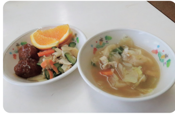
〈特別給食〉 郷土料理のすいとん 県特産品のかんぴょうのサラダ

6月15日、「県民の日」にあわせて、保育園では、郷土料理のすいとんや、県特産品のかんぴょうが入ったサラダの特別給食と、おやつに九尾のきつねにちなんだ稲荷ずしが園児たちに振る舞われました。 千振保育園では、食べる前に園児たちに料理や食材に関心を持ってもらえるよう特別給食の話をしました。 園児たちは、話を聞いて想像を膨らませたあと、特別給食をもらい食べ、お腹を膨らませていました。