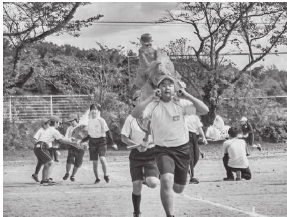
運動会に代わるスポーツフェスティバル(学びの森小学校)

(教育長) 中学校は感染リスクを考え東北方面に行き先を変えて実施予定だったが、宮城アラートが引き上げられたため、安心安全を考慮し日帰り旅行。小学校は実施予定だが、ガイドラインや旅行先の感染状況に応じ実施の可否を判断したい。