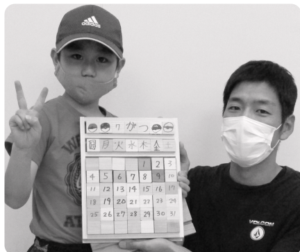
親子で協力し、世界に一つだけのカレンダーを完成させました