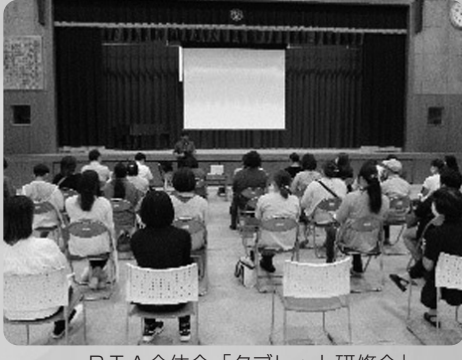
PTA全体会「タブレット研修会」

6月30日に、保護者対象のタブレット研修会を行いました。事前に行ったタブレットの使い方や使用時間についてのアンケートの結果をもとに、GIGAスクールサポーターの指導のもと、「ネットを安全に使うために」と「iPadの操作方法」について学びました。