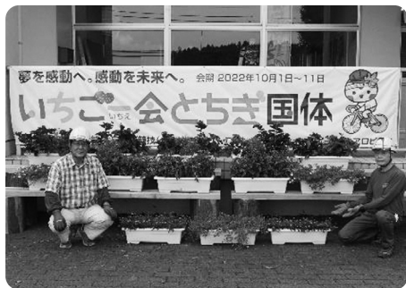
那須町森林組合のみなさんのアイデアで間伐材を活用したプランター台が完成しました

本町も含まれる八溝地域は、日光と並んで県を代表する林業地です。素性がよく強度もある八溝杉は、那須ブランドに認定されています。