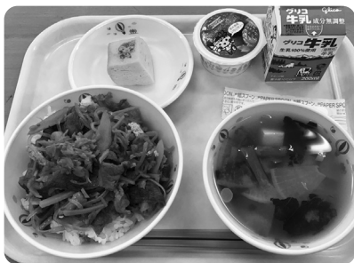
栄養士たちがアイデアを出し合い考案した栄養たっぷりで見栄えも楽しい献立(那須中央中)