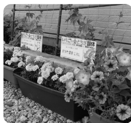
きれいな花と黄色の応援プレートで彩られています(那須町農業公社)

町民総ぐるみで町を花いっぱいにし、全国から訪れる方をおもてなしの心で歓迎するため、花いっぱい運動を実施しています。現在、自治公民館や町内の事業所、団体皆さまに協力いただき、お花とともに応援プレートを設置しています。