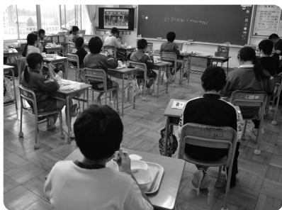
栄養士による給食の説明や小学生のいちご一會ダンスの動画をみながら、給食を楽しみました(黒田原小)