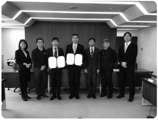
連携協定締結式（令和3年3月22日）

町は、特定非営利法人「みんなのコード」（東京都渋谷区）とテクノロジー教育に関する連携協定を結んでいます。この協定は、最先端のプログラミングやコンピュータ教育を全校で実施できるようにすることを目指し、先生が必要や実践方法を理解した上で授業ができるよう支援を受けるものです。今年度はNAISUタイムプログラミング教育指定推進校として東陽小学校と那須中学校を中心に支援を受けています。次年度以降は町内の各学校へ広げていく予定です。