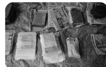
水損資料の応急処置

■会期 10月8日(金)～12月19日(日) ■入館料 200円(中学生以下無料) ■休館日 毎週月曜日(祝日の場合は翌日)