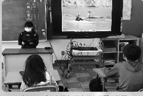
パラリンピック紹介(総合的な学習の時間)

本校では、さまざまな学習場面や家庭学習などでタブレットを活用しています。生活科や理科では、観察日記を記録として保存したり、実験前の予想を友だちと共有しています。国語や算数では、語彙力アップのプリントや授業の導入で行う小テストをロイロノートで行っています。画面を直接指で触れて解答ができるので、短時間で学習することができ、その結果を児童が自分のタブレットから教師に送信し、教師が直接コメントを記入して児童に返信しています。さらに、総合的な学習の時間では、調べた内容を大型テレビに映しながら発表しています。