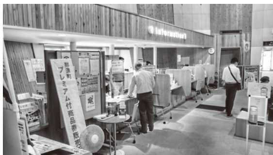
整備が進む観光交流センター

答 〔町長〕 観光振興や情報発信場所としてハブ機能を持った観光の入口になるように再整備しており、特別扱いで進めているものではない。