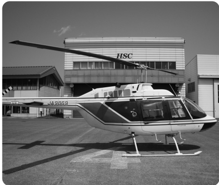
散布に使用するヘリコプター