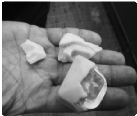
散布する経口ワクチン