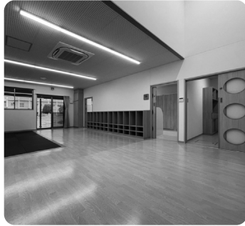
明るい光が差し込む保育室