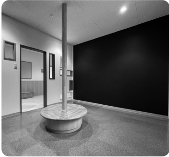
子ども創造力を伸ばす、 らくがきコーナー