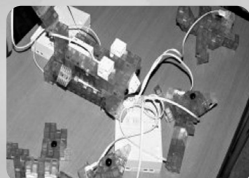
NAISUタイム プログラミング教育