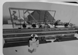
マイクラフト作品発表 未来の田代友愛小学校