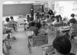
iPadの使い方教室 (橋本屋協力)