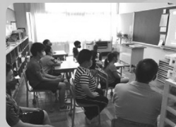
オンライン朝会 オンライン児童集会