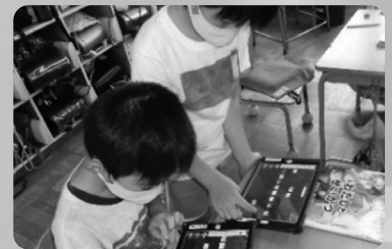
▲ロイロノートで伝え合い(2年)