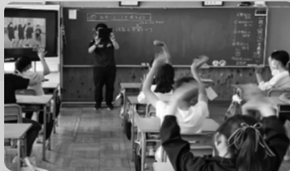
▲ZOOMを活用した大野小との交流学習(3年)

フォーム作成ツール「Google Forms」を各種アンケートの実施や毎朝の健康チェックに活用することで、集計作業や一元管理の効率化を図っています。さらに職員間の会議資料等の共有を「Classroom」で行い、紙の削減につなげています。