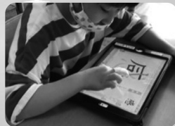
児童用デジタル 教科書実証事業