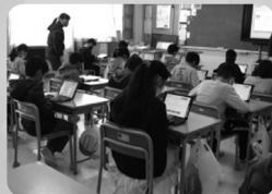
NAISUタイム タイピング練習