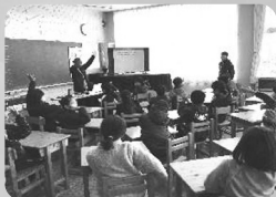
ネットモラル教室 (GIGAサポーター協力)