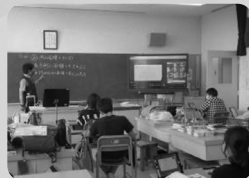
分散教室 リモート授業