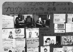
プレゼンフェスティバル プログラミングの町、那須