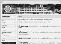
学校ホームページの充実 (地域教育コーディネーター)