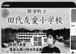
放送委員会 YouTube校内作品展