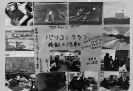
パソコンクラブ (星野アグリ教室推進「ボイ付」整備)