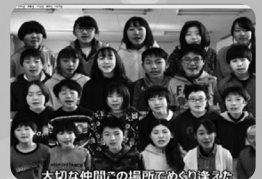
大切な仲間との場所であぐら登校 リモート卒業式 ヴァーチャル合唱