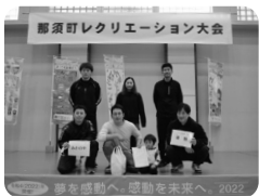
▲那須町レクリエーション大会