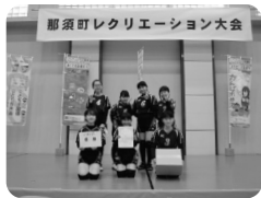
▲ソフトバレーボール優勝チーム