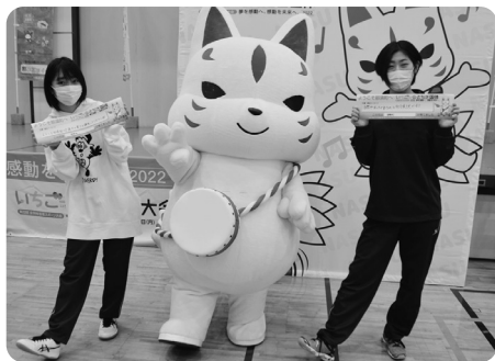
本町を訪れる方々を笑顔でお迎えます