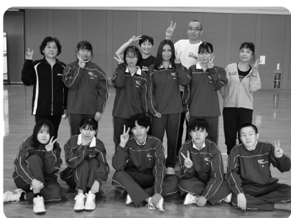
エアロビックをとおして地域との交流を深めた那須高校の皆さん

地域への温かい思いがとちぎ国体の成功へとつながり、地域の絆がさらに深まる大会を目指して、引き続き、準備を進めていきます。