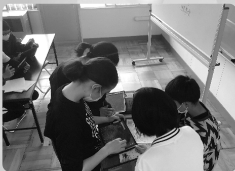
学校行事の調べ学習の様子

プログラミングの基礎を学習しています。コンピュータにどのように命令を出せば自分が考えたように動かすことができるのか、確かめながら学習に取り組んでいます。キャラクターを動かしたり、ターゲットを撃ち落とすゲームを作ったりしています。