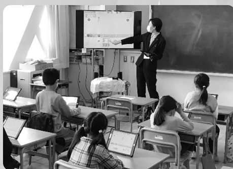
プログラミング学習の授業風景

4月から児童一人につき一台のタブレットが貸与され、授業や家庭学習など、さまざまな場面で活用しています。