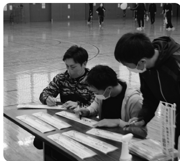
選手が全力を尽くせるよう心のこもったメッセージを考えました

応援と歓迎のメッセージを書きました。温かな気持ちを入れたメッセージシールは、町内の国体会場に設置予定の花プランターに添えて、来場者をお迎えます。