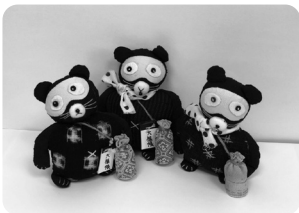
かわいいためきの酔っぱらいの飾り物が出来上がります