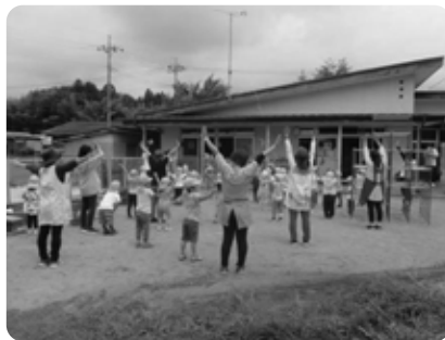
オリジナル体操「なすの森でぼうけんだ〜!」

大同保育園 では、園児が遊びの内容を話し合って決めていきます。園児は、園庭の固定遊具のほか、身近にあるものを使って遊び、好奇心や粘り強さを培い、達成感を味わっています。主体的な遊びを通して、園児が楽しく体を動かし、多様な体の動きを体験するための工夫が評価されての受賞となりました。