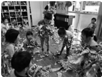
新聞紙を破って、集めて!