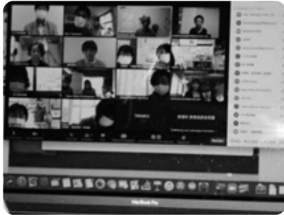
自宅で受講する保護者とも意見を交換しました