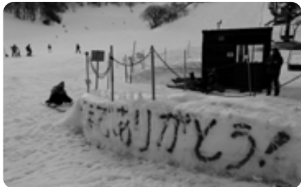
「今日までありがとう!」と、感謝の言葉が刻まれていました