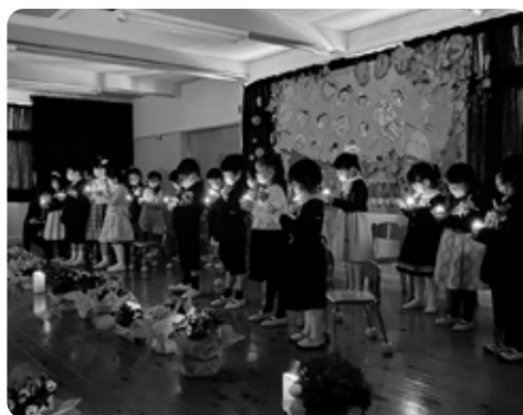
▶キャンドルを大切に持つ園児たち。最後は静かに火を消し、園とお別れしました。