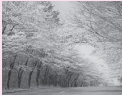
▲ 台上地区の桜並木

台上地区の桜並木 桜のアーチをくぐり抜けるドライブコースとして隠れた人気がある台上道路の桜並木。那須連山を望む高原道路約3キロにわたり、500本のソメイヨシノと100本のオオヤマザクラが植えられています。4月中旬から下旬に見ごろになります。