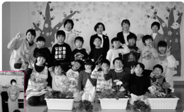
▶温かい雰囲気にも包まれた「思い出コンサート」

第2部は、午後3時半から園庭で行われ、平山町長は「温かく見守ってくれた地域の皆さまに感謝する」とあいさつしました。その後、「高久保育園ありがとう」の合図に合わせて、保護者や園児らが約100個の風船を空に飛ばし、保育園との別れを惜しみました。