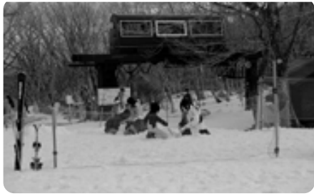
名残り惜しうにスキーや雪遊びをする人でいっぱいでした