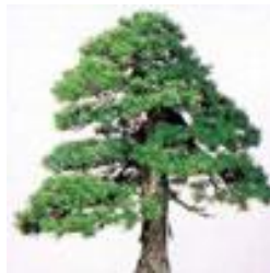
◇町の木 ゴヨウマツ