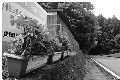
自転車ロードレースコース沿いに飾られたプランターで大会を盛り上げます

町民総ぐるみで町を花いっぱいにし、全国から訪れる方々を真心のこもったおもてなしで歓迎するため、花いっぱい運動を実施しています。現在、町内の事業所や団体の方々にご協力をいただき、花とともに応援プレートや選手へのメッセージ入りのシールを貼ったプランターを設置しています。近くを通りかかった際は、ぜひご覧ください。