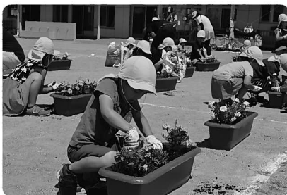
お手伝いで花植えをしたことがある園児も多く、手際よく植えることができました

7月7日、黒田原第1保育園で、年長組26人がプランターにマリーゴールドを植えました。園長先生から「全国から那須町に来る方々をきれいなお花を飾ってお迎えしましょう」と話を聞いた園児たちは、オレンジや黄色のマリーゴールドを丁寧に植えていきました。また、プランターの側面には、園児一人一人が選手への応援メッセージを書いたシールを貼りました。子どもたちが心を込めて作った花プランターは、大会当日、会場に飾り、選手たちの熱い戦いに花を添えます。