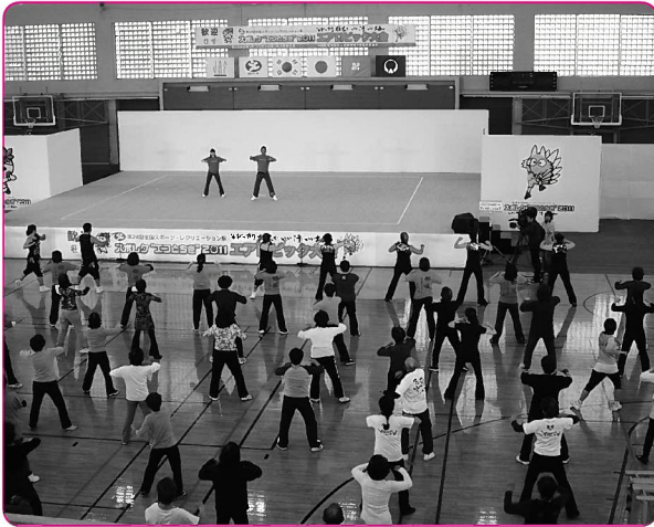
全国スポーツ・レクリエーション祭の様子