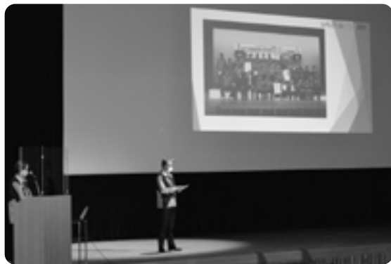
大会報告会の様子

大会報告会では、国体那須町開催における経過や町実施競技の大会当日の様子、今後の取り組みについて報告し、盛会に幕を閉じた国体那須町開催を映像とともに振り返りました。