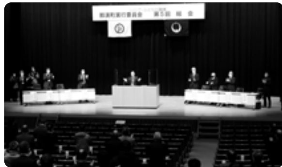
最後の開催となる総会は3本締めて終了しました

いちご一会とちぎ国体をおしりて地域の連帯感が一層深まり、そこで得た経験や絆は、持続可能で魅力あるまちづくりの礎となります。令和元年8月の町実行委員会設立から約3年半にわたり、町民の皆さんのご理解とご協力を賜り、誠にありがとうございました。