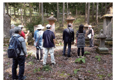
史跡見学会の様子