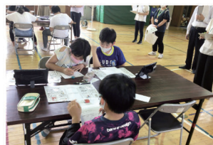
人間関係プログラム