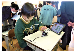
プログラミング教育