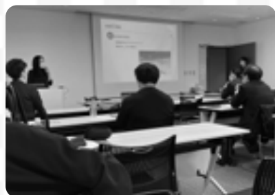
企業向けにワークベース那須をPRする様子

那須町での暮らしにもすっかり慣れ、早くも2年目を迎えました！ 昨年度は主に、民間企業・団体と公民連携で行う事業に対して、それぞれの組織構造の違いから双方のコミュニケーションに課題があると感じ、それらを円滑に推進できるようにお手伝いをしてきました。 また、移住定住施策としてワークベース那須のPRや地元企業に就職希望の学生への魅力を発信してきました。活動を通じて、町には「人」「資源」「熱い思い」が