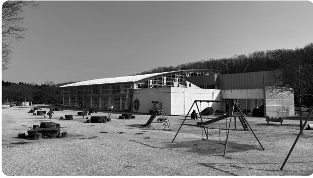
余笹川ふれあい公園