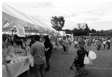
「第17回那須九尾まつり」の様子。たくさんの人でにぎわいました。

▼交通規制の時間 午前9時30分～午後3時30分 ※交通規制を行う区間は、左の地図のとおりです。