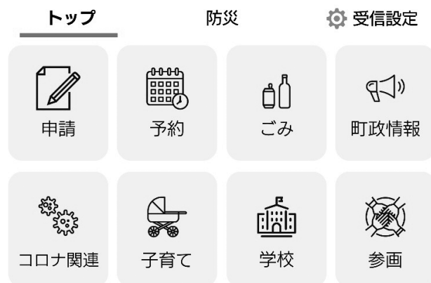
リッチメニュー (イメージ)

見出し部分を切り替えて、それぞれのアイコンをクリックし、知りたい情報を簡単に探すことができます。