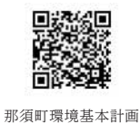
那須町環境基本計画