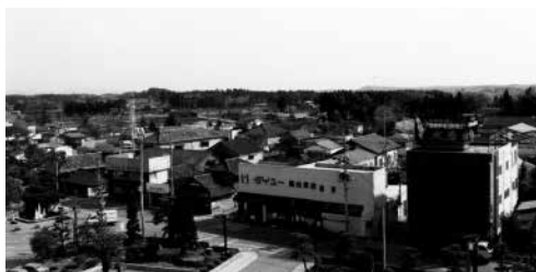
那須町役場前(昭和62年)