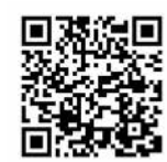
確定申告書等 作成コーナー