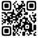
移住者交流会の問合せ

那須町出身で、移住コーディネーターとして4年目を迎えました。地元で育った立場から、那須町の魅力や暮らしぶりを丁寧に伝え、移住希望者の「理想」と「現実」のギャップが少しでもなくなるよう心掛けて相談に応じています。相談内容は住まいや仕事だけでなく、地域ごとの特色や人との関わり方など、実際の生活に寄り添ったサポートを大切にしています。