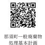
那須町一般廃棄物処理基本計画