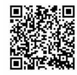
スマホご利用ガイド