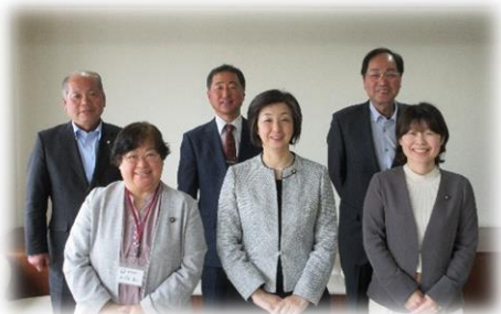
総務産業常任委員

総務課、企画政策課、財政課、税務課、農林振興課、建設課、観光商工課、会計課、上下水道課、農業委員会、議会事務局及び監査委員事務局の所管に関する事務