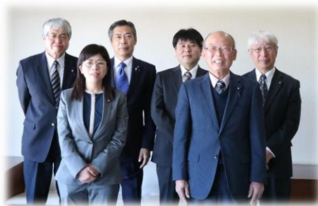
民生文教常任委員

住民生活課、環境課、保健福祉課、ふるさと定住課及び教育委員会(学校教育課・生涯学習課・こども未来課)の所管に関する事務