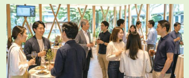
「なすとらん」立食懇親会イメージ

【注意事項】 ※プログラムは天候や運営上の都合により一部変更になる場合があります。 ※プログラム中は各自マイカーまたはレンタカーで移動をお願いします。 ※当日は身分証をお持ちください。 ※プログラム内で撮影する写真を町のHPやSNSで使うことがあります。 ※参加確定後にキャンセルされた場合には、実費相当のご負担をいただきます。 ※宿泊時のお部屋割りについては相部屋となる可能性があります。