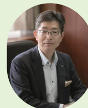
那須町 副町長 平山 浩之