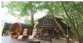
[Nasu terrace MANA & LEI]