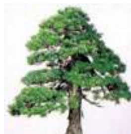
◇町の木 ゴヨウマツ