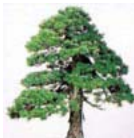
◇町の木 ゴヨウマツ