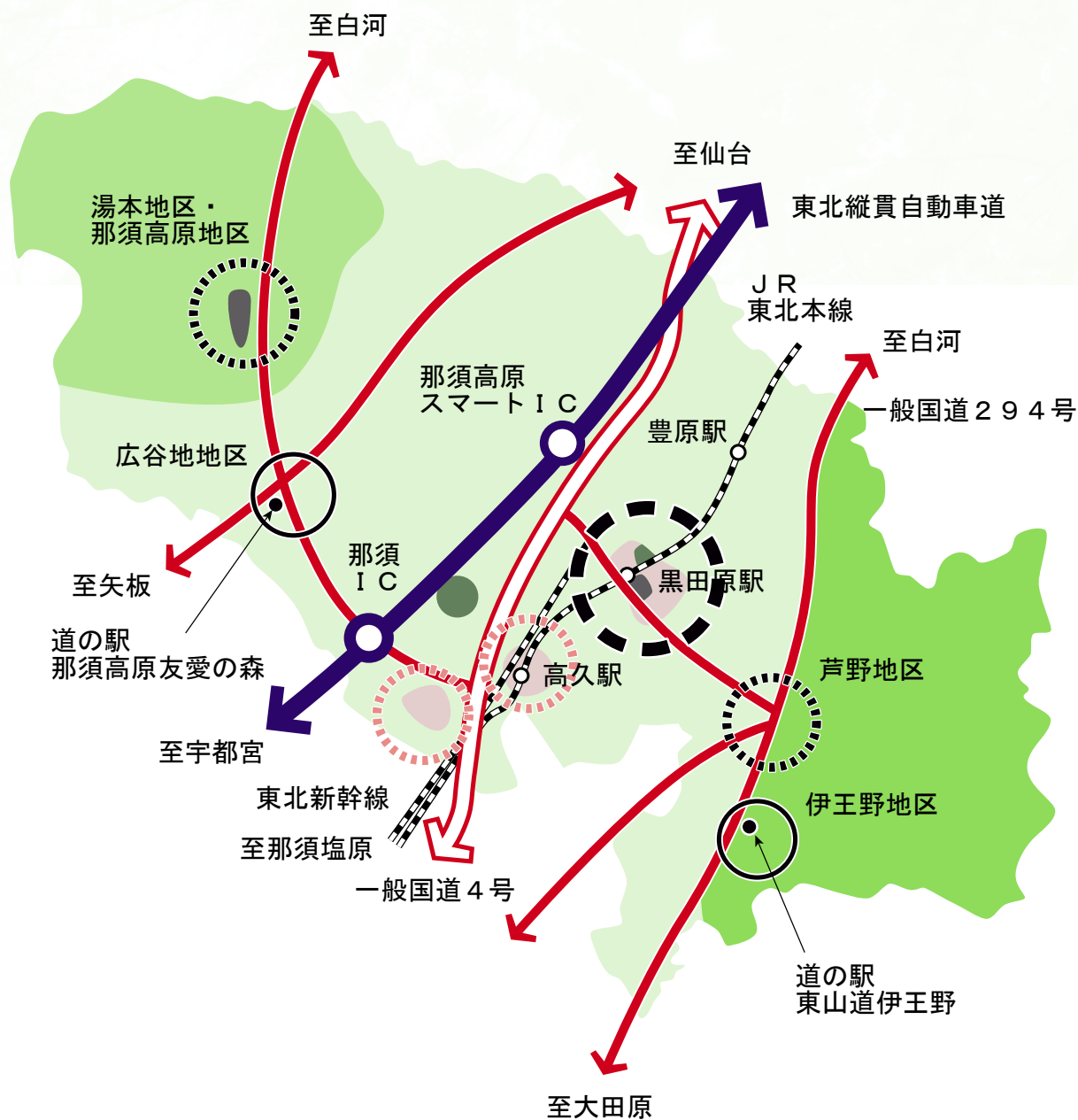
— 図：まちの空間構造 —