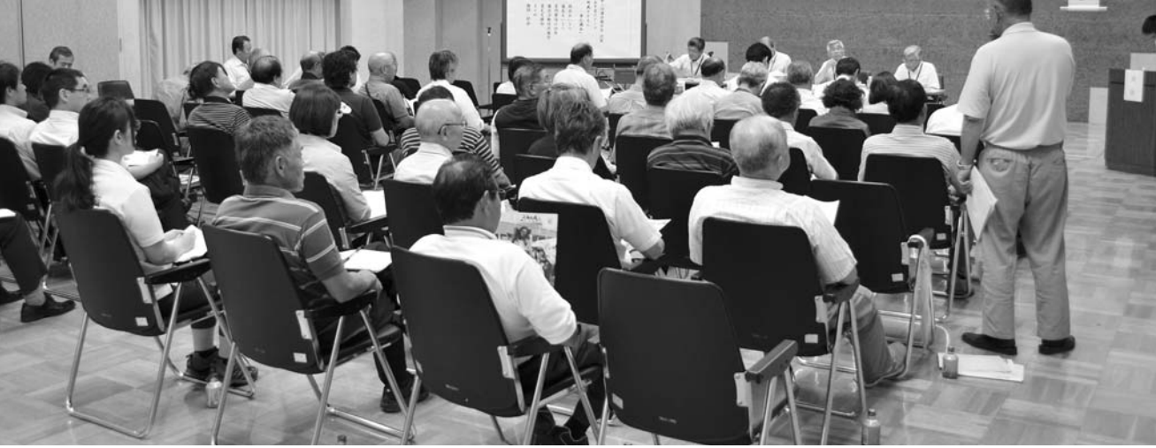
7月17日那須町文化センター会場