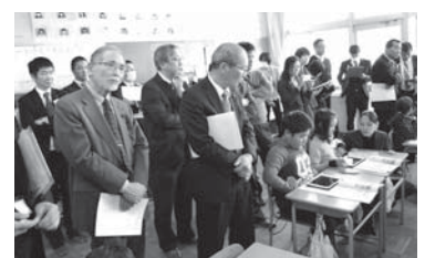
町ICT教育活用研究会