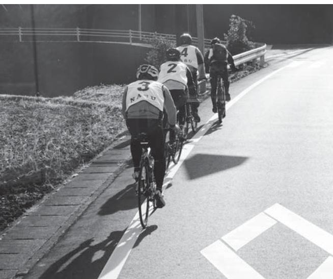
健康増進のサイクルスポーツ

サイクルスポーツが前面に出ているが、今の課題として認識しているので、住民にもっと自転車に乗っていただくような機会を増やしていきたい。今後PRに努めていく。