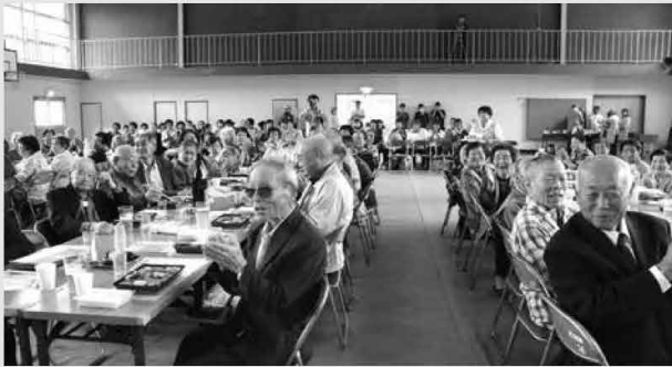
梓自治公民館による余興「あずさ大喜利」に会場は大盛り上がり。優しいヤジも飛びつつ、会場は大きな笑い声に包まれました(9/17 旧美野沢小学校体育館)

役場ってこんなところ？町長さんのお仕事は？3年生17名が役場庁舎を見学しました(9/22 高久小学校)