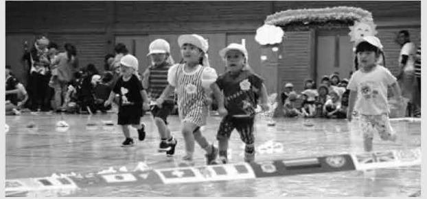
あいにくの天気で那須小学校体育館での開催となりました。来年は晴れますように(9/6 那須高原保育園)

今年も町内7つの保育園で秋の大運動会が開催されました。元気に走り、かわいく踊り、一生懸命な姿で観客を笑顔にしました。