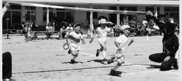
つなげバトン！リレーは会場が一番盛り上がりです。応援席からも大きな声援があがりました(9/9 黒田原第1保育園)

今年の新米を早速試食。食欲の秋の到来です。(9/17 大綱芋煮と新米まつり 道の駅東山道伊王野)